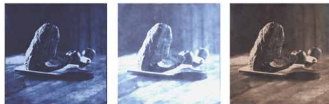
Una cianotipia esposta più a lungo (a sinistra), poi schiarita sbiancando (al centro), e virata (a destra). Il contrasto diminuisce con l'elaborazione, le ombre divengono così di nuovo visibili.

Con il tempo possono essere testate varie combinazioni di sbiancamento e viraggio.